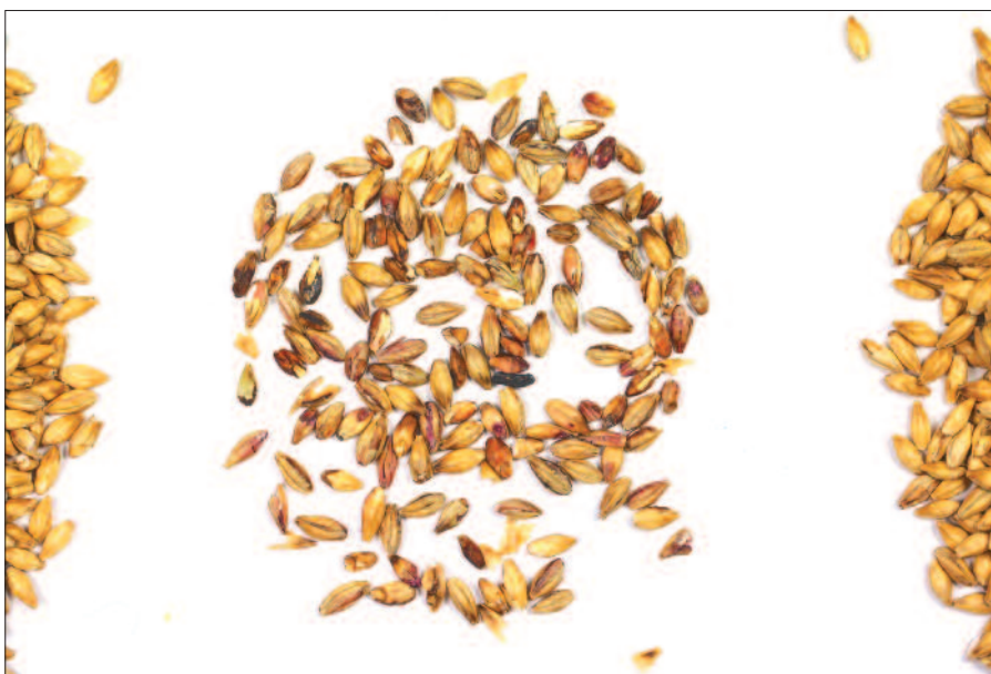
Rohmaterial, Schlechtmaterial aus erster Sortierung Kanal eins bis vier, Gutmaterial (v.l.)

Bei Tests, die mit der Maschine durchgeführt wurden, war zu untersuchen, wie sich das Sortierergebnis in Bezug auf Mykotoxine und Gushing-Potenzial in den jeweiligen Sortierfraktionen auswirkt. Dazu wurden mehrere definierte Gerstenmalze deutscher Mälzereien verwendet. Die sortierten Anteile wurden bezeichnet als Gutmaterial, Schlechtmaterial und finaler Rest aus dem zweiten Durchlauf des Schlechtmaterials.