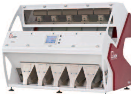
Anlagen von ein bis fünf Kanälen möglich, hier ASM VISION Fünfkanal-Farbsortierer

Die neueste Generation der Farb- und Formsorierer ASM Vision sind in der Lage sowohl unerwünschte als