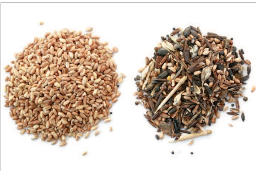
Erste Sortierung auf Fremdbesatzentfernung bei Weizen durch ASM VISION